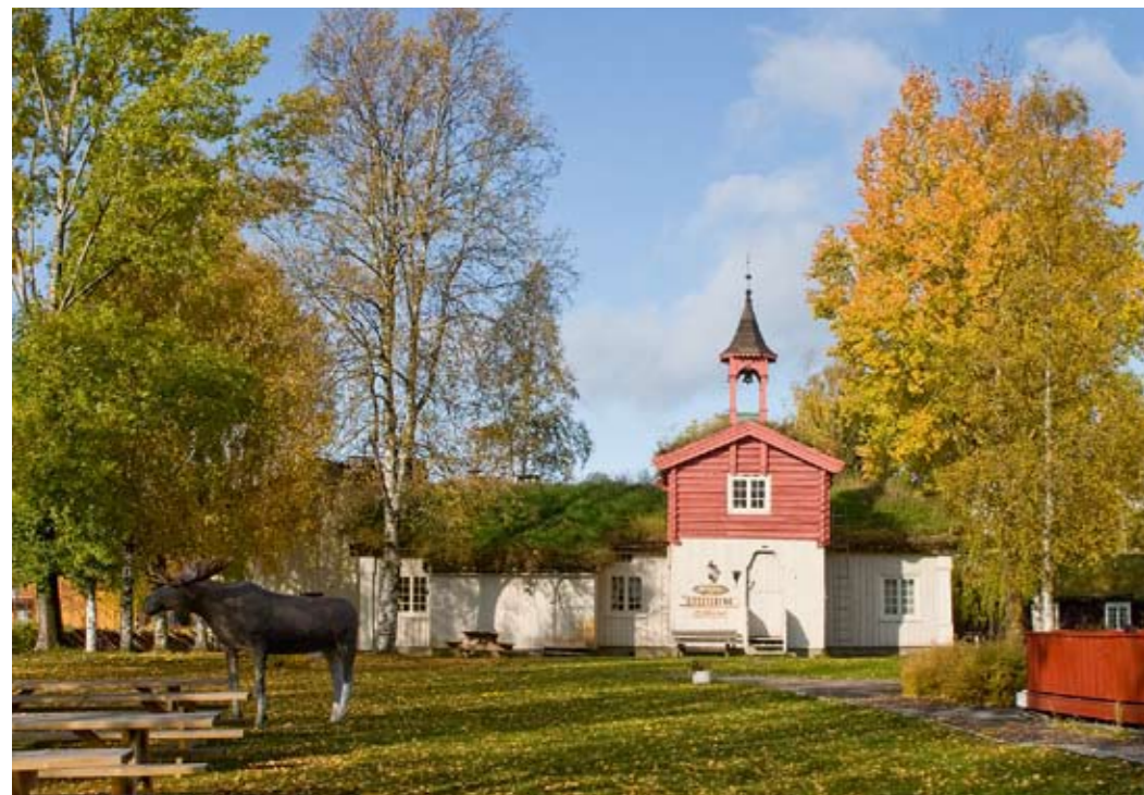
Ane Hjort Guttu/Tyra Tronstad: Koppangtunet , 1978/2008